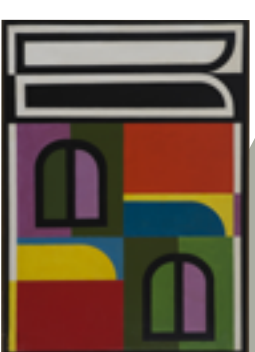
Jo Delahaut Bahnol, 1954

Ces artistes rejettent d'un côté la tradition figurative de la peinture, mais également les formes de création spontanée (comme Cobra ). Il s'agit pour eux de retrouver un équilibre intérieur, de proposer un temps en suspension dans le monde chaotique de l'après-guerre. Ils reprennent la maxime du Bauhaus « Less is more » et reviennent aux éléments essentiels de la peinture en opérant des agencements rigoureux de formes, de lignes, de couleurs en aplats, qui ne comportent aucune référence au monde réel. Certains peintres évolueront tout naturellement vers l'art minimaliste, né aux États-Unis dans les années 60, tandis que d'autres jeteront les bases de l'art cinétique.